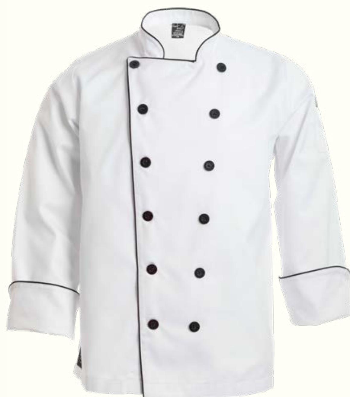
23. Clásica con Vivo