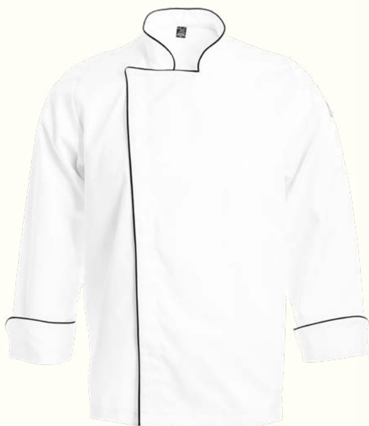
17. Clásica Broches con Vivo