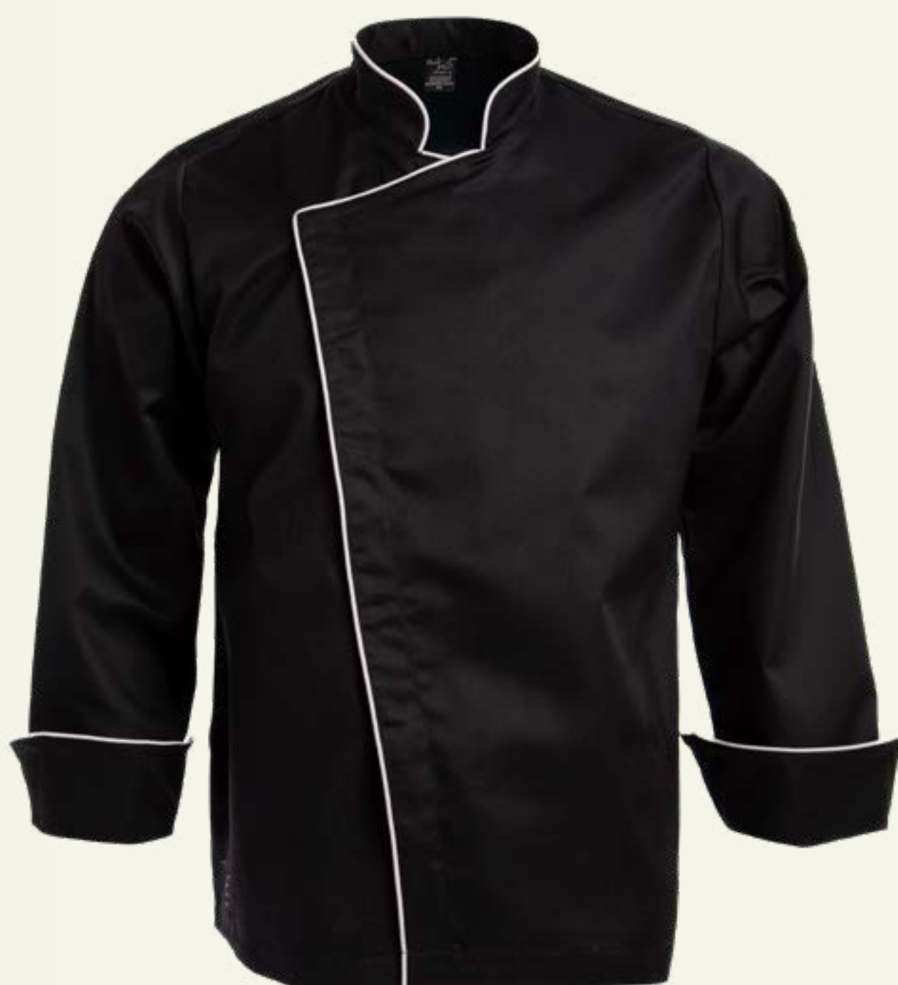
38. Raganno Clásica