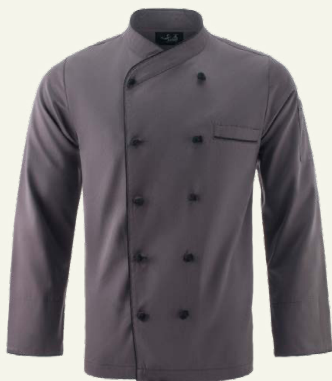
25. Francesa Ejecutiva