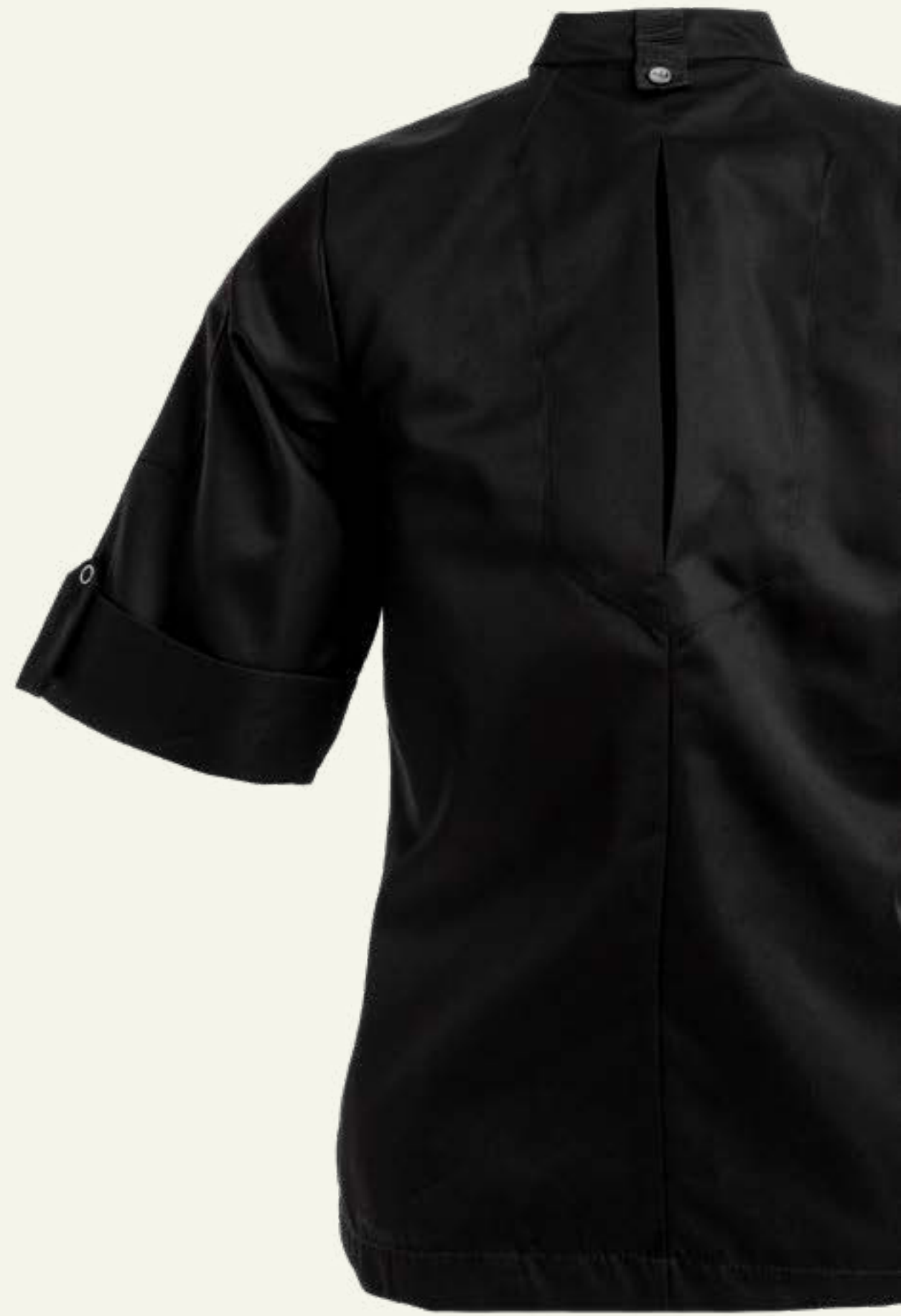
48. Sport Broches