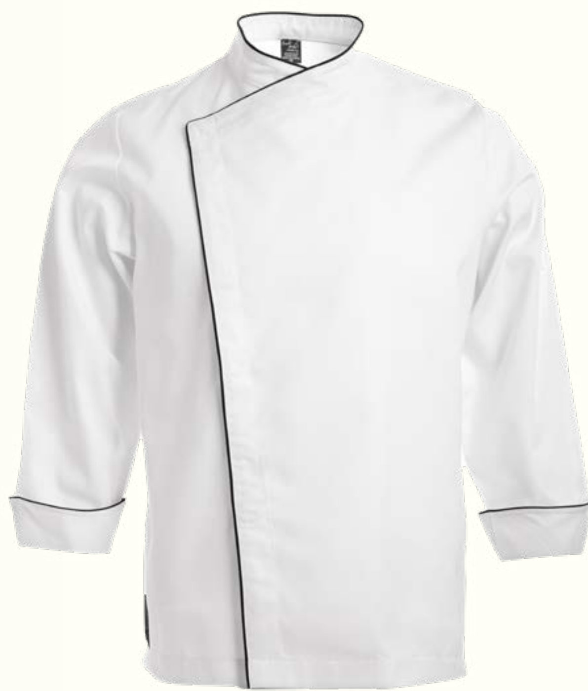
40. Broches con Vivo