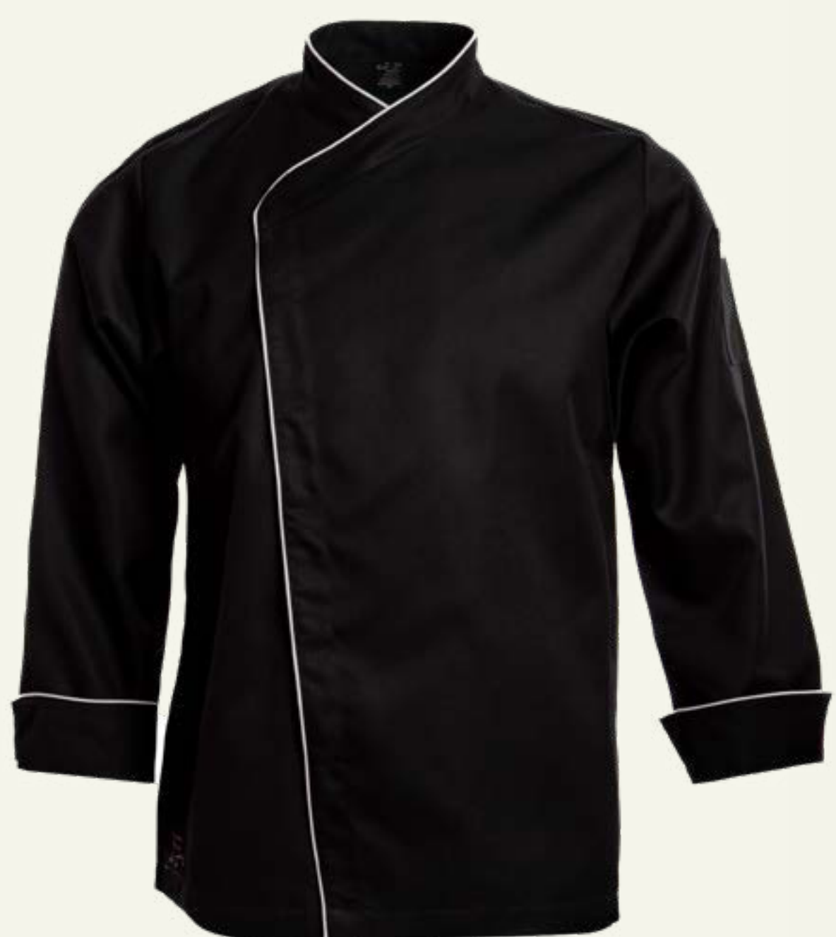
24. Francesa con Vivo