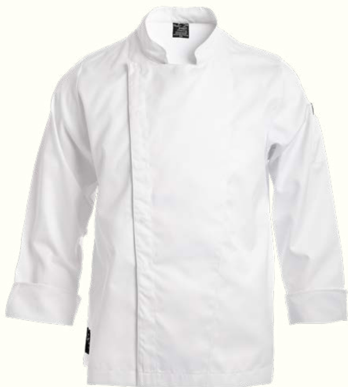
22. Clásica Broches