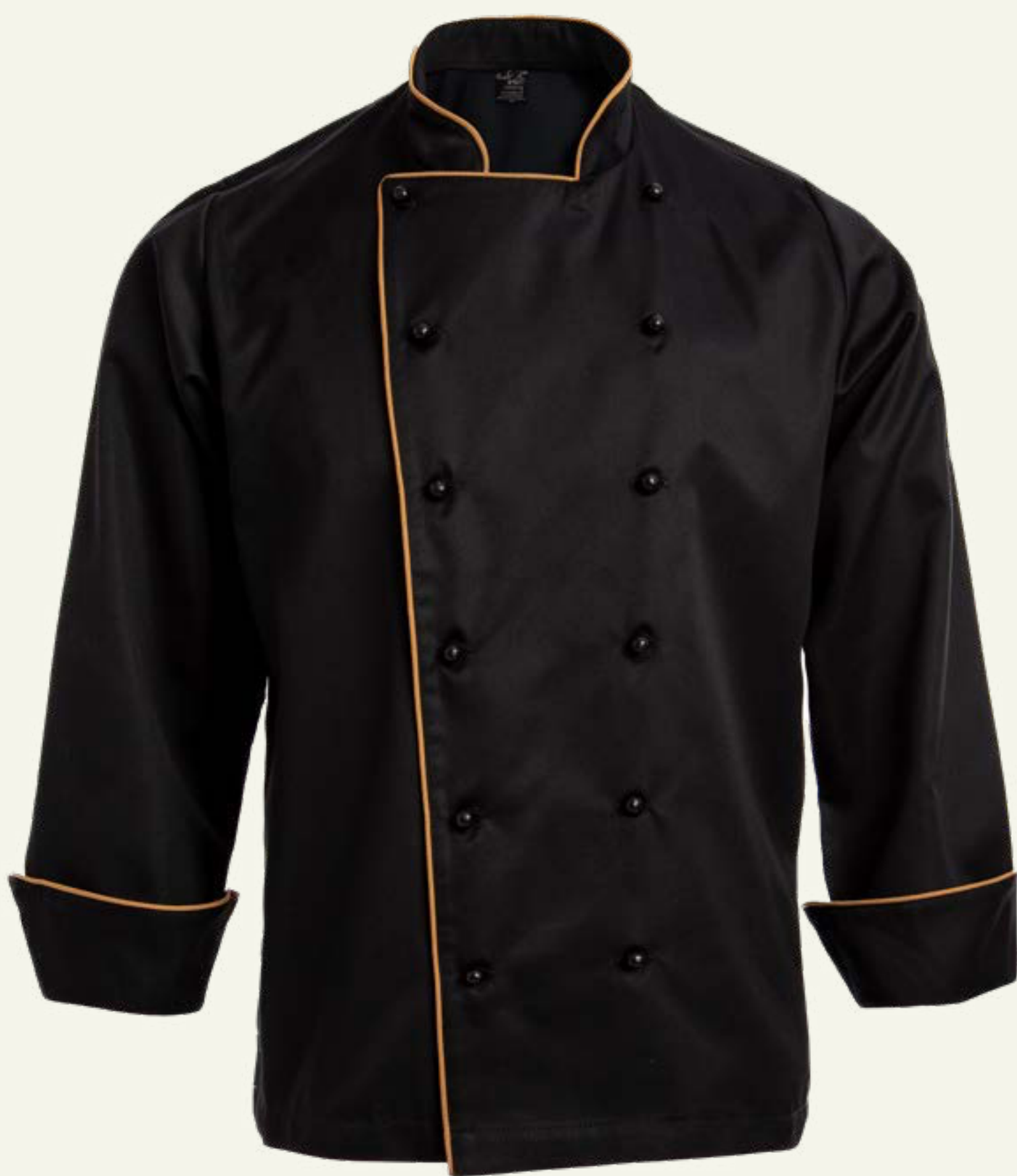
26. Clásica Ejecutiva